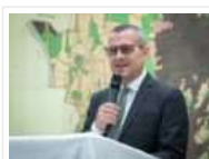
„Sono rimasto sconvolto“