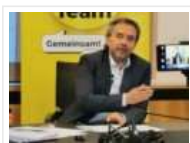
Rute im Fenster